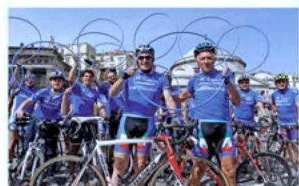
La pedalata amatoriale con i testimonial riservata ai clienti Mediolanum è una delle iniziative tradizionali della banca legate al Giro d'Italia

Per l'undicesimo anno consecutivo il Gruppo presieduto da Ennio Doris, attraverso la sponsorizzazione del Gran Premio della Montagna, conferma dunque la propria partecipazione alla manifestazione sportiva che, una volta approdata in Ita-