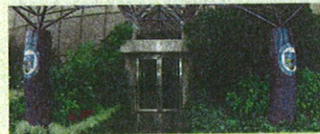
L'ingresso di Mediolanum Corporate University (MCU) a Milano