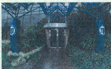
L'ingresso di Mediolanum Corporate University (MCU) a Milano

Con l'obiettivo di formare i Family Banker del futuro, i professionisti finanziari d'eccezione, attraverso un percorso di studi di altissimo livello, dalla collaborazione tra il MIP - la Business School del Politecnico di Milano -, e Mediolanum Corporate University (MCU) - l'università aziendale di Banca Mediolanum -, nasce il Master Universitario in Family Banking. Si tratta di un vero e proprio Master universitario, della durata di 12 mesi, che rilascia un titolo di studio con valore legale. Metà delle 52 giornate d'aula previste si svolgeranno al MIP, l'altra metà in MCU a Milano, presso la sede di Banca Mediolanum, a cui si aggiungeranno le attività di affiancamento e formazione sul campo presso i Family Banker Office e le altre strutture sul