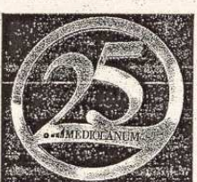
Quest'anno ricorre il 25° anniversario della nascita del Gruppo Mediolanum, fondato da Ennio Doris il 2 febbraio del 1982