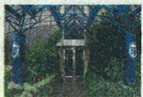
L'ingresso della Mediolanum Corporate University (MCU) a Milano

sumi, le aziende riorganizzate e snellite durante la crisi lavorano a pieno ritmo e sono piene di soldi da impiegare come mai in precedenza, i reinvestimenti negli ultimi sei mesi sono aumentati del 60% rispetto a un anno fa. Quest'anno la crescita economica sarà del 3,5%, a due cifre il rendimento dei titoli azionari. Sono in fase di espansione i settori energia, tecnologia, servizi sanitari. La notizia che la convalescenza del mercato azionario americano è terminata