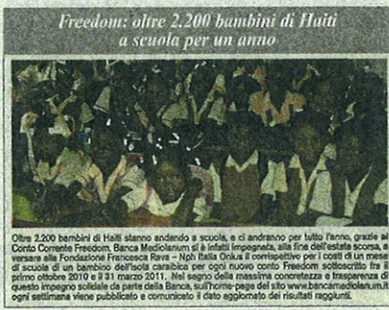
Freedom: oltre 2.200 bambini di Haiti a scuola per un anno. Oltre 2.200 bambini di Haiti stanno andando a scuola, e ci andranno per tutto l'anno, grazie al Conto Corrente Freedom Banca Mediolanum e al contributo della Fondazione Francesca Rava e Nph Italia Onlus. Il contributo per i costi di un mese di scuola di un bambino dell'area caraibica per ogni nuovo conto Freedom sottoscritto fra il primo ottobre 2010 e il 31 marzo 2011. Nel segno della massima concretezza e trasparenza di questo impegno sociale da parte della Banca, sull'home-page del sito www.bancamediolanum.it ogni settimana viene pubblicato e comunicato il dato aggiornato dei risultati raggiunti.

collegato: per ogni nuovo Conto Freedom, aperto dal primo ottobre scorso fino al prossimo 31 marzo, Banca Mediolanum garantirà un mese di scuola a un bambino di Haiti, sostenendo le attività della Fondazione Francesca Rava N.P.H. Italia Onlus, in stretta collaborazione con Fondazione Mediolanum. Un'iniziativa che, attraverso la sovvenzione a carico esclusivo della Banca e non del correntista, dall'inizio di ottobre 2010 ha già permesso di donare a oltre 2.200 bambini haitiani la possibilità di frequentare la scuola per un intero anno. In sostanza, convenienza, vantaggi e solidarietà, insieme in un conto corrente.