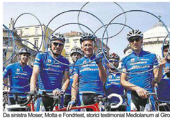
Da sinistra Moser, Motta e Fondriest, storici testimonial Mediolanum al Giro

E lo ha fatto ancora una volta come sponsor del Gran Premio della Montagna con la maglia azzurra, dedicata al miglior "scalatore", simbolo di italianità ma non solo: anche di impegno, sacrificio, e forza del singolo individuo ma allo stesso tempo della capacità di fare squadra e del lavoro di gruppo. Concetti in profonda sintonia con i valori e la filosofia sui quali poggia l'esperienza di Banca Mediolanum. Come sempre, anche per l'edizione 2015 la presenza di Banca Mediolanum al Giro d'Italia, che si concluderà a Milano il 31 maggio, sarà arricchita da pranzi esclusivi su invito lungo il percorso, cene di gala in location di ecce-