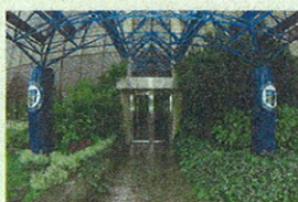
L'ingresso di Mediolanum Corporate University (MCU) presso la sede della Banca a Milano3

Con l'obiettivo di formare i Family Banker del futuro, i professionisti finanziari d'eccellenza, attraverso un percorso di studi di altissimo livello, dalla collaborazione tra il MIP - la Business School del Politecnico di Milano - e Mediolanum Corporate University (MCU) - l'università aziendale di Banca Mediolanum - nasce il Master Universitario in Family Banking. Si tratta di un vero e proprio Master universitario, della durata di 12 mesi, che rilascia un titolo di studio con valore legale. Metà delle 52 giornate d'aula previste si svolgeranno al MIP, l'altra metà in MCU a Milano3, presso la sede di Banca Mediolanum, a cui si aggiungeranno le attività di affiancamento e formazione sul campo presso i Family Banker Office e le altre strutture sul territorio della Banca. «La figura professionale specifica del Family Banker esiste dal 2005,