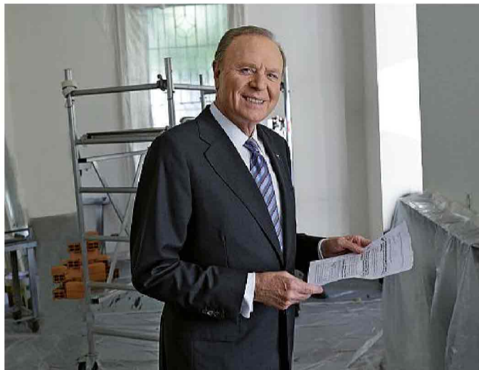
Ennio Doris sul set dello spot Tv dedicato a Mediolanum Riparti Italia

«Banca Mediolanum ha già dimostrato molte volte, nel tempo e in maniera molto concreta, questo suo sostegno e l'attenzione verso la propria clientela» sottolinea Ennio Doris, «ora sentiamo l'esigenza di intervenire in un mercato dove i mutui vengono erogati con il con-