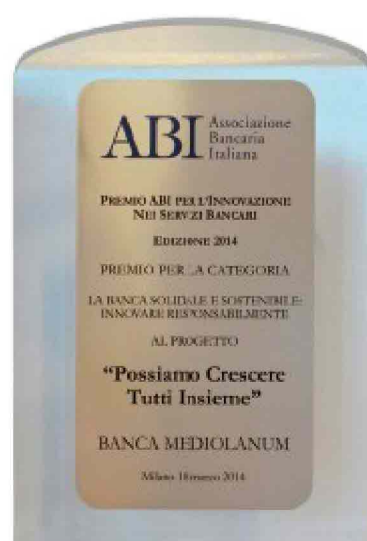
Il premio assegnato dall'ABI

di tutti coloro che vengono colpiti da varie avversità. Solamente nel corso del 2013, in seguito alle numerose alluvioni che hanno colpito diverse regioni italiane, Banca Mediolanum è intervenuta stanziando 1.600.000 euro a favore delle famiglie dei clienti e Family Banker che hanno subito danni. Oltre a ciò, sono state previste diverse agevolazioni tra le quali la possibilità di sospensione della rata mutui e prestiti per 12 mesi, l'attivazione di linee di credito privilegiate, la riduzione di un punto percentuale dello spread in essere su mutui e prestiti per 24 mesi e l'azzeramento di tutti i costi dei conti correnti e depo-