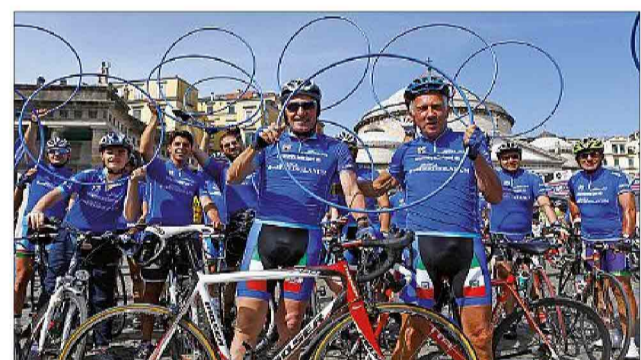
La pedalata amatoriale riservata ai clienti Mediolanum è una delle iniziative tradizionali della Banca legate al Giro d'Italia

deri dei propri clienti. Come ogni anno anche per l'edizione 2014 la presenza di Banca Mediolanum al Giro d'Italia, che si concluderà a Trieste il prossimo 1º giugno, sarà arricchita da avvenimenti paralleli alla gara e da piacevoli occasioni di incontro: da pranzi esclusivi su invito lungo il percorso delle tappe più emozionanti alle cene di gala in location d'eccezione. Cene riservate che nel corso di questa edizione, per la prima volta, saranno arricchite da un set fotografico dove gli ospiti potranno posare con i testimonial storici di Banca Mediolanum: Francesco Moser, Gianni Motta, Maurizio Fondriest e Paolo Bettini, e portarsi a casa la foto-ricordo della serata. Sempre in compagnia dei testimonial, proseguono anche per il 2014 le "pedalate" amatoriali in partenza e in arrivo di tappa, che nel 2013 hanno visto la partecipazione di oltre 1.000 appassionati; e l'accoglienza nelle aree hospitality da dove clienti e appassionati, esclusivamente su invito, potranno vivere da vicino l'emozionante arrivo al traguardo. Ampio