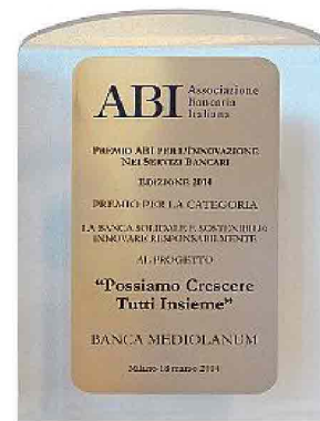
Il premio assegnato dall'ABI

Solamente nel corso del 2013, in seguito alle numerose alluvioni che hanno colpito diverse regioni italiane, Banca Mediolanum è intervenuta stanziando 1.600.000 euro a favore delle famiglie dei clienti e Family Banker che hanno subito danni. Oltre a ciò, sono state previste diverse agevolazioni tra le quali la possibilità di sospensione della rata mutui e prestiti per 12 mesi, l'attivazione di linee di credito privilegiate, la riduzione di un punto percentuale dello spread in essere su mutui e prestiti per 24 mesi e l'azzeramento di tutti i costi dei conti correnti e deposito Titoli per 24 mesi. Interventi messi in campo anche negli scorsi anni in occasione del terremoto in Emilia-Romagna, e prima ancora in Abruzzo, delle allu-