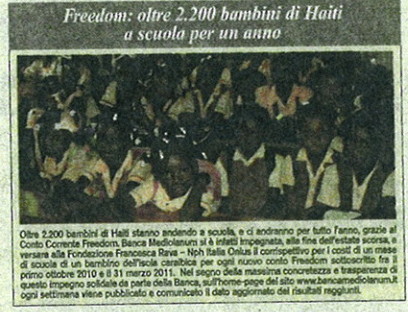
Freedom: oltre 2.200 bambini di Haiti a scuola per un anno. Oltre 2.200 bambini di Haiti stanno andando a scuola, e ci andranno per tutto l'anno, grazie al Conto Corrente Freedom, Banca Mediolanum. Il contributo per i costi di un mese di scuola di un bambino dell'isola caraibica per ogni nuovo conto Freedom sottoscritto fra il primo ottobre 2010 e il 31 marzo 2011. Nel segno della massima concretezza e trasparenza di questo impegno sociale da parte della Banca, sull'home-page del sito www.bancamediolanum.it ogni settimana viene pubblicata e comunicata i dati aggiornati dei risultati raggiunti.

collegato: per ogni nuovo Conto Freedom, aperto dal primo ottobre scorso fino al prossimo 31 marzo, Banca Mediolanum garantirà un mese di scuola a un bambino di Haiti, sostenendo le attività della Fondazione Francesca Rava N.P.H. Italia Onlus, in stretta collaborazione con Fondazione Mediolanum. Un'iniziativa che, attraverso la sovvenzione a carico esclusivo della Banca e non del correntista, dall'inizio di ottobre 2010 ha già permesso di donare a oltre 2.200 bambini haitiani la possibilità di frequentare la scuola per un intero anno. In sostanza, convenienza, vantaggi e solidarietà, insieme in un conto corrente.