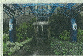
L'ingresso di Mediolanum Corporate University (MCU) presso la sede della Banca a Milano3

Con l'obiettivo di formare i Family Banker del futuro, i professionisti finanziari d'eccellenza, attraverso un percorso di studi di altissimo livello, dalla collaborazione tra il MIP - la Business School del Politecnico di Milano -, e Mediolanum Corporate University (MCU) - l'università aziendale di Banca Mediolanum -, nasce il Master Universitario in Family Banking. Si tratta di un vero e proprio Master universitario, della durata di 12 mesi, che rilascia un titolo di studio con valore legale. Metà delle 52 giornate d'aula previste si svolgono al MIP, l'altra metà in MCU a Milano3, presso la sede di Banca Mediolanum, a cui si affiancheranno le attività di affiancamento e formazione sul campo presso i Family Banker Office e le altre strutture sul territorio della Banca. «La figura professionale specifica del Family Banker esiste dal 2005,