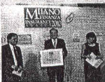
Ennio Doris durante la premiazione

no a dei piani previdenziali li rischiano di vivere una quarta età miserabile, in vista dell'inevitabile taglio delle pensioni pubbliche, della revisione degli indici di sopravvivenza e dell'innalzamento dell'età pensionabile» ha osservato Ennio Doris, avvertendo che «i quarantenni di oggi devono riflettere attentamente i loro calcoli ipotizzando che la loro pensione si possa ridurre alla metà o addirittura a un terzo». Di qui la grande, storica oppor-