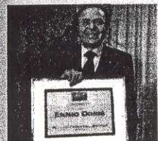
Ennio Doris ritira il Premio Guido Carli

Quattro nuovi e prestigiosi riconoscimenti si aggiungono al già fitto palmarès di Mediolanum. Lunedì 16 marzo, a Milano, si è svolta la cerimonia di premiazione degli MF - Milano Finanza Global Awards 2009, nel corso di un 'charity dinner'. I Global Awards di Milano Finanza si dividono in cinque categorie di premi singoli: Tripla A, MF Innovazione Award, Guido Carli, Creatori di Valore e Leone d'Oro. E il Gruppo Mediolanum ha fatto incetta dei premi dedicati ai protagonisti e alle più importanti società del mondo bancario, finanziario e della comunicazione, che hanno realizzato le migliori performance nel corso del 2008. Il Premio