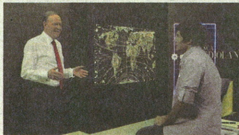
Lo spot Tv con il Presidente di Banca Mediolanum, Ennio Doris

nanziare un mese di scuola di un bambino di Haiti per ogni Conto Freedom che verrà sottoscritto. Un onere che la Banca ha deciso di sostenere. Non è insomma a carico del cliente». In questo modo diminuiranno gli utili per Banca Mediolanum? «No» dichiara il Responsabile della Comunicazione, «perché a favore di Haiti saranno stanziati fondi diversamente destinati a iniziative di marketing. Questo è quello che ci aspettiamo: che il nuovo cliente, aderendo a questa 'missione' - ovvero permettere a un bambino di Haiti di andare a scuola - la faccia propria e inviti a sua volta nuovi clienti ad aderire. Il messaggio che il Presidente Ennio Doris manda attraverso lo spot è molto chiaro. Dice letteralmente: possiamo crescere insieme». Perché avete fatto questa scelta, di devolvere una parte degli introiti dei nuovi