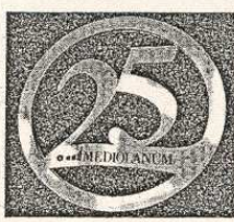
Quest'anno ricorre il 25° anniversario della nascita del Gruppo Mediolanum, fondato da Ennio Doris il 2 febbraio del 1982

Entra in Banca Mediolanum basta una telefonata 840 704 444 www.bancamediolanum.it