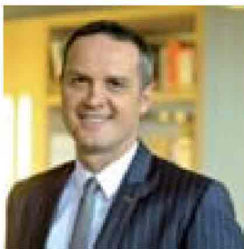
In alto Massimo Doris a destra una delle serate "Riparti Italia" che si sono svolte in tutta Italia con Ennio Doris

viene messo il ruolo della Banca: dare "un aiuto in più" al cliente in questo momento in cui continuano gli incentivi fiscali per le ristrutturazioni. Una spinta in più. Concreta, reale. La "banca costruita intorno a te" oggi costruisce insieme con te permettendoti di dare più valore alla tua casa, per te, per i tuoi figli, e anche per il mondo intero, visto che le ristrutturazioni possono portare a un minor dispendio di energia, e a una maggiore qualità dell'aria e dell'ambiente se tanti decidono di ristrutturare. La campagna, realizzata da Red Cell, ha previsto tutti i mezzi: radio e televisioni, web, cinema e affissioni. Duemila gli spot - di mezzo minuto ciascuno - su Mediaset, La 7, Sky, Mediaset Premium, Cielo, Discovery Channel, Class CNBC. Seicentocinquanta i comunicati sulle stazioni radiofoniche RTL, Radio DeeJay, RDS, Radio 24, Radio 101, RMC, e 23 annunci su quotidiani e periodici.