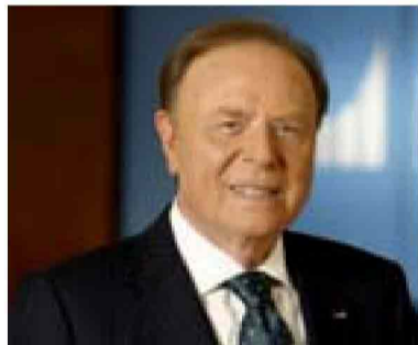
Ennio Doris spiega il successo di un modello che è riuscito a battere la crisi

quelli delle banche online. Mentre rispetto a queste ultime possediamo un valore in più: il capitale umano dato dai family banker. Professionisti di altissimo livello con competenze a tutto tondo ed estremamente radicati sul territorio. Il nostro modello coniuga il vecchio e il nuovo, la relazione e