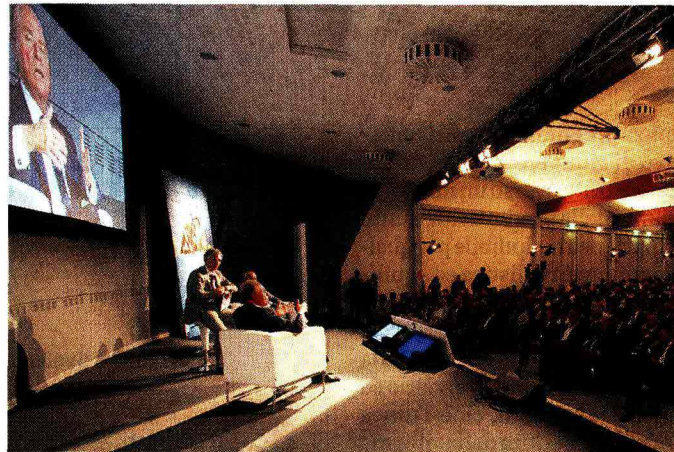
Una delle serate "Riparti Italia" che si sono svolte in tutta Italia con Ennio Doris

L'iniziativa in questione è Mediolanum Riparti Italia, l'offerta da parte di Banca Mediolanum, avviata nei mesi scorsi, di mutui a tassi vantaggiosi per realizzare e rendere possibili quei lavori di ristrutturazione delle proprie case e il rinnovo degli impianti domestici per una maggiore efficienza energetica, per i quali sono previsti anche gli incentivi fiscali dello Stato.