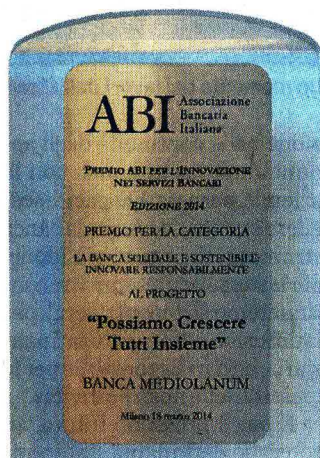
Il premio assegnato dall'ABI

dei propri clienti e più in generale di tutti coloro che vengono colpiti da varie avversità. Solamente nel corso del 2013, in seguito alle numerose alluvioni che hanno colpito diverse regioni italiane, Banca Mediolanum è intervenuta stanziando 1.600.000 euro a favore delle famiglie dei clienti e Family Banker che hanno subito danni. Oltre a ciò, sono state previste diverse agevolazioni tra le quali la possibilità di sospensione della rata mutui e prestiti per 12 mesi, l'attivazione di linee di credito privilegiate, la riduzione di un punto percentuale dello spread in essere su mutui e prestiti per 24 mesi e l'azzera-