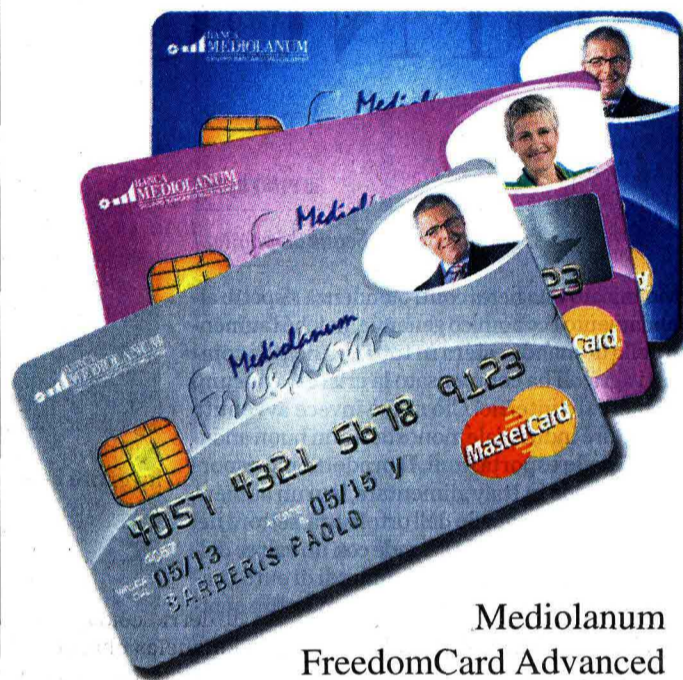
Mediolanum FreedomCard Advanced

Completa di tante funzioni pratiche e vantaggiose. Tecnologica e sicura. E in più, novità da cogliere al volo, può essere gratuita per 3 anni.