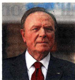
di Ennio Doris*

Siamo alla vigilia di una svolta epocale. Banca Mediolanum è pronta per accompagnare i suoi clienti a coglierne le opportunità. La svolta nasce dalla tecnologia che, da quando esiste, sempre sovverte l'ordine in una specie di rivoluzione silenziosa ma inarrestabile. A darle una accelerazione è stata la crisi finanziaria e poi economica.