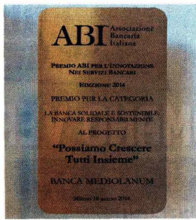
Il premio assegnato dall'ABI

aiuto concreto anche nelle situazioni di difficoltà e bisogno, siano esse momenti di tensione finanziaria (nel cui quadro si inserisce l'attuale taglie dello 'spread' sui mutui), oppure disagi dovuti alle calamità naturali. È proprio in queste ultime occasioni che l'impegno di Banca Mediolanum si traduce in una vera e propria esperienza solidale e sostenibile a sostegno dei propri clienti e più in generale di tutti coloro che vengono colpiti da varie avversità. Solamente nel corso del 2013, in seguito alle numerose alluvioni che hanno colpito diverse regioni italiane, Banca Mediolanum è intervenuta stanziando 1.600.000 euro a favore delle famiglie dei clienti e Family Banker che hanno subito danni. Oltre a ciò, sono state previste diverse agevolazioni tra le quali la possibilità di sospensione della rata mutui e prestiti