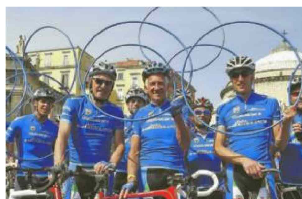
Da sinistra Moser, Motta e Fondriest, storici testimonial Mediolanum al Giro

di squadra. Dalla pagina dedicata all'evento sportivo, storiedalgiro.it che nel 2014 ha avuto oltre 21mila visite, alla presenza in diretta su Twitter (circa 4mila Tweet dedicati nel 2014) e Facebook (381 post dedicati): a dimostrazione del fatto che anche in questo caso Banca Mediolanum dedica un'attenzione a 360 gradi alla manifestazione. Come di consuetudine all'impegno "sul campo" verrà affiancata una delle numerose iniziative solidali promosse da Fondazione Mediolanum Onlus: in particolare quest'anno i fondi raccolti saranno destinati a tre associazioni che si occupano di 959 bambini ospitati nelle Case Famiglie sparse sul territorio nazionale: Sos Villaggi dei Bambini, Associazione Comunità Papa Giovanni XXIII e Casa Famiglia Spirito Santo.