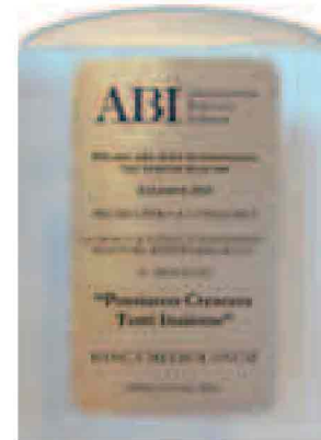
Il premio assegnato dall'ABI

Solamente nel corso del 2013, in seguito alle numerose alluvioni che hanno colpito diverse regioni italiane, Banca Mediolanum è intervenuta stanziando 1.600.000 euro a favore delle famiglie dei clienti e Family Banker che hanno subito danni. Oltre a ciò, sono state previste diverse agevolazioni tra le quali la possibilità di sospensione della rata mutui e prestiti per 12 mesi, l'attivazione di linee di credito privilegiate, la riduzione di un punto percentuale dello spread in essere su mutui e prestiti per 24 mesi e l'azzeramento di tutti i costi dei conti correnti e depositi Titoli per 24 mesi. Interventi messi in campo anche negli scorsi anni in occasione del terremoto in Emilia-Romagna, e prima ancora in