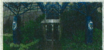
L'ingresso di Mediolanum Corporate University (MCU) a Milano