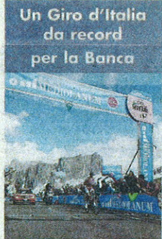
L'arrivo sul Cima Coppi nel Gran premio della montagna

L'accesso è a numero chiuso per un totale di 40 posti, è prevista una selezione attraverso test attitudinali e colloqui individuali. La graduatoria finale delle selezioni porterà anche all'assegnazione di alcune Borse di studio, messe a disposizione di Banca Mediolanum, a favore dei frequentanti più meritevoli.