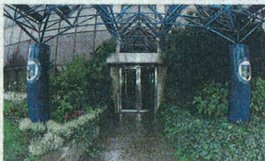
L'ingresso di Mediolanum Corporate University (MCU) a Milano

Si tratta di un vero e proprio Master universitario, della durata di 12 mesi, che rilascia un titolo di studio con valore legale. Metà delle 52 giornate d'aula previste si svolgeranno al MIP, l'altra metà in MCU a Milano, presso la sede di Banca Mediolanum, a cui si affiancheranno le attività di affiancamento e formazione sul campo presso i Family Banker Office e le altre strutture sul