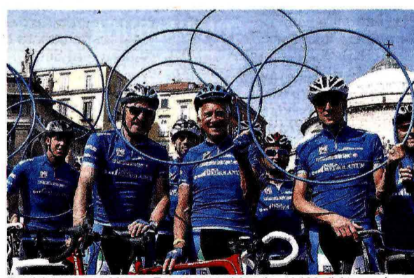
Da sinistra Moser, Motta e Fondriest, storici testimonial Mediolanum al Giro

Per il tredicesimo anno consecutivo Banca Mediolanum è salita in sella prendendo parte alla 98esima edizione del Giro d'Italia, partenza da Sanremo il 9 maggio. E lo ha fatto ancora una volta come sponsor del Gran Premio della Montagna con la maglia azzurra, dedicata al miglior "scalatore", simbolo di italianità ma non solo: anche di impegno, sacrificio, e forza del singolo individuo ma allo stesso tempo della capacità di fare squadra e del lavoro di gruppo. Concetti in profonda sintonia con i valori e la filosofia sui quali poggia l'esperienza di Banca Mediolanum. Come sempre, anche per l'edizione 2015 la presenza di Banca Mediolanum al Giro d'Italia, che si concluderà a Milano il 31 maggio, sarà arricchita da pranzi esclusivi su invito lungo il percorso, cene di gala in location di eccezione, pedalate amatoriali e tante altre iniziative parallele alla manifestazione sportiva caratterizzate dalla presenza di testimonial d'eccezione tra i quali Francesco