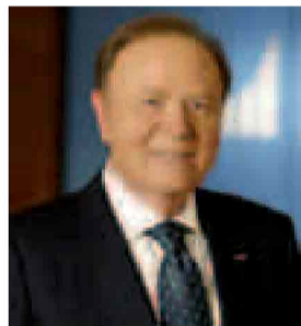
Ennio Doris spiega il successo di un modello che è riuscito a battere la crisi