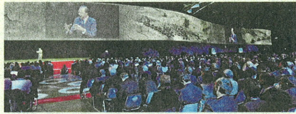
Un momento dell'evento di Rimini per i Family Banker Mediolanum

Ma offre ai clienti un ulteriore modo di entrare in Banca con la semplicità, la chiarezza e la trasparenza di sempre. Con "accesso diretto" Banca Mediolanum conferma il suo ruolo di Banca innovativa e multicanale, capace di soddisfare le esigenze di un numero sempre maggiore di clienti, adattandosi ai loro comportamenti, stili di vita e modi di comunicare.