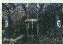
L'ingresso della Mediolanum Corporate University (MCU) a Milano

sumi, le aziende riorganizzate e snellite durante la crisi lavorano a pieno ritmo e sono piene di soldi da impiegare come mai in precedenza, i reinvestimenti negli ultimi sei mesi sono aumentati del 60% rispetto a un anno fa. Quest'anno la crescita economica sarà del 3,5%, a due cifre il rendimento dei titoli azionari. Sono in fase di espansione i settori energia, tecnologia, servizi sanitari. La notizia che la corruzione del mercato azionario americano è terminata