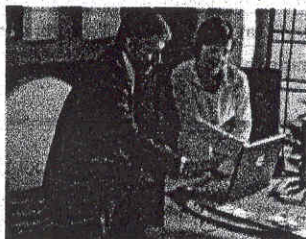
Consulenza personale con i Global Banker

Forte preparazione professionale, aggiornamento continuo, carriera e soddisfazioni che crescono in linea con i risultati raggiunti, sono alcuni degli aspetti principali che caratterizzano l'attività dei Family Banker Mediolanum, gli oltre 5mila consulenti finanziari che garantiscono un'assistenza continua e personalizzata a ogni singolo cliente della Banca, in tutta Italia.