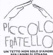
UN TETTO NON SOLO D'AMORE PER I BIMBI DI STRADA

Basta un Sms solido per far crescere il "Piccolo Fratello". Dal 1° al 28 febbraio, come nel 2006, viene riproposta la raccolta fondi, con un breve messaggio via telefono cellulare, per sostenere il progetto etico-sociale portato avanti da Fondazione Mediolanum. Tutti i clienti Tim, Vodafone, Wind e H3G potranno mandare un Sms al numero unico 48545; non occorre scrivere alcun testo in quanto è sufficiente l'invio del messaggio solido per assicurare 2 euro all'iniziativa dando così il proprio contributo personale. L'obiettivo di Fondazione Mediolanum è offrire un futuro migliore ai bambini dei Paesi in via di sviluppo