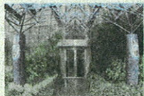
L'ingresso della Mediolanum Corporate University (MCU) a Milano

aziende riorganizzate e snellite durante la crisi lavorano a pieno ritmo e sono piene di soldi da impiegare come mai in precedenza, i reinvestimenti negli ultimi sei mesi sono aumentati del 60% rispetto a un anno fa. Quest'anno la crescita economica sarà del 3,5%, a due cifre il rendimento dei titoli azionari. Sono in fase di espansione i settori energia, tecnologia, servizi sanitari. La notizia che la convalescenza del mercato azionario americano è termi-