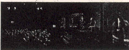
Ennio Doris nel corso della conferenza stampa al teatro Manzoni di Milano

Rivoluzionario? Doveroso, per Doris. Che ha deciso di aprire un fondo di solidarietà, a partire dal 1° ottobre, destinato ai mutuatari di prima casa colpiti da malattie o infortuni che determinino una grave invalidità permanente, per estinguere debiti residui fino a 250 mila euro. Il Fondo sarà inizialmente alimentato dal 5 per mille della raccolta realizzata con la vendita del nuovo servizio Double Chance (vedi articolo in questa pagina). In altre parole, il mutuo non costerà di più al cliente, sarà la banca a destinarvi una parte dei propri ricavi: 8 milioni di euro nei prossimi 22 anni per i mutuatari attuali, che saliranno a 50 milioni con i mutui che saranno nel frattempo sottoscritti. Già in giugno la banca aveva annunciato che dal 1° settembre avrebbe ridotto unilateralmente, cioè automaticamente, senza alcuna contrattazione da parte del cliente, i mutui bancari sia ai clienti nuovi sia a quelli vecchi, calolan-