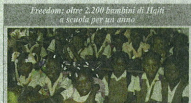
Freedom: oltre 2.200 bambini di Haiti a scuola per un anno

legato: per ogni nuovo Conto Freedom, aperto dal primo ottobre scorso fino al prossimo 31 marzo, Banca Mediolanum garantirà un mese di scuola a un bambino di Haiti, sostenendo le attività della Fondazione Francesca Rava N.P.H. Italia Onlus, in stretta collaborazione con Fondazione Mediolanum. Un'iniziativa che, attraverso la sovvenzione a carico esclusivamente della Banca e non del correntista, dall'inizio di ottobre 2010 ha già permesso di donare a oltre 2.200 bambini haitiani la possibilità di frequentare la scuola per un intero anno. In sostanza, convenienza, vantaggi e solidarietà, insieme in un conto corrente.