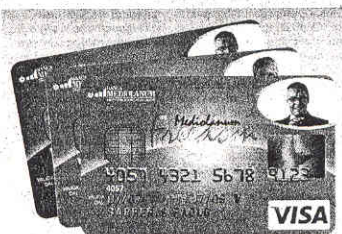
foto del titolare), e tutto il denaro versato è sempre immediatamente disponibile, fino all'ultimo centesimo. Costo del conto corrente: zero, con una giacenza media pari a 15mila euro o con un patrimonio gestito oltre i 30mila euro. Negli altri casi: 5 euro al mese. Principali operazioni bancarie, come prelievi Boncomat, bonifici, Rid, pagamento utenze: gratuite. Servizio di Sms Alert disponibile sul proprio cellulare per segnalare ogni operazione e ogni movimento di denaro sul conto, non solo in caso di prelievi allo sportello automatico, come ulteriore garanzia di sicurezza e praticità.

A VANTAGGIO DEL CLIENTE L'ammontare massimo di capitale remunerabile al 2,5% netto, in giacenza su un conto, è stato poi aumentato: mentre fino a settembre era previsto un limite a quota 500mila euro, ora questo limite è stato portato a un milione di euro. In più, Freedom non è un conto solo online, perché i professionisti del Banking Center e i Family Banker Mediolanum sono sempre a disposizione di ogni cliente per tutta l'assistenza necessaria nella gestione del conto e nell'effettuare tutte le operazioni. La totale trasparenza e condizioni più favorevoli per il cliente sono anche garantite nell'aggiornamento degli interessi, mentre con altri conti correnti disponibili sul mercato il calcolo degli interessi maturati viene effettuato dopo mesi o alla fine dell'anno, con Freedom il cliente ha i propri interessi aggiornati quotidianamente, giorno per giorno.