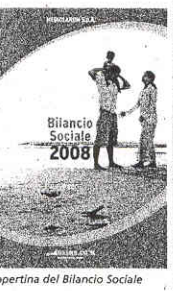
La copertina del Bilancio Sociale

In un Gruppo come Mediolanum oltre alle soluzioni finanziarie, alle tecnologie innovative e ai servizi di qualità alla clientela, oltre a capitali, risparmi e investimenti, c'è molto altro ancora. Ci sono i valori aziendali, la cultura d'impresa, l'attenzione all'ambiente, l'impegno nel campo della solidarietà e della solidarietà, la trasparenza e l'affidabilità nei confronti di clienti, dipendenti, collaboratori, fornitori e investitori, tutti gli stakeholder e i portatori di interessi coinvolti a vario titolo nelle attività d'impresa. Risultati, resoconti e progetti sono raccolti all'interno del Bilancio Sociale di Mediolanum, la cui ultima edizione riferita al 2008 è disponibile online ( www.mediolanum.com ), in una versione "navigabile" in maniera semplice, veloce, immediata. Tra i temi trattati, una parte