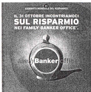
La locandina dell'evento di sabato 31 ottobre

Con l'obiettivo di diffondere l'alfabetizzazione e la cultura finanziaria al grande pubblico dei risparmiatori e investitori, Banca Mediolanum partecipa attivamente, come tradizione ormai consolidata, alla Giornata Mondiale del Risparmio (l'85esima edizione). E sabato 31 ottobre organizza una giornata aperta e rivolta a tutti, sia ai propri clienti che ai risparmiatori interessati ad approfondire temi e questioni che riguardano le scelte da prendere in materia di risparmi, investimenti, previdenza, servizi bancari. Un evento straordinario che si svolge in contemporanea in tutta Italia per chi vuole saperne di più su soluzioni di risparmio, opportunità d'investimento, e avere aggiornamenti e informazioni, incontrare direttamente gli esperti del settore, l'appuntamento è fissato presso 223 Family Banker Office, gli uffici commerciali della Banca presenti sul territorio, di altrettante città, comuni e località di tutta la Penisola. Dove chiunque lo desideri, gratuitamente e con partecipa-