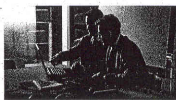
Family Banker, consulenza di fiducia