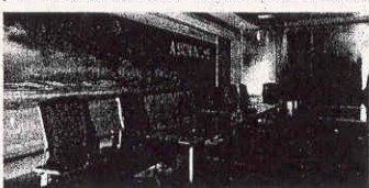
Qui sopra, una delle 24 aule che compongono la struttura formativa, dove si svolgono corsi, incontri e seminari.