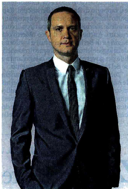
Massimo Doris, amministratore delegato di Banca Mediolanum.

Come farlo? Controllando determinati criteri che nel complesso indicano lo stato di salute della banca stessa: innanzitutto la sua solidità patrimoniale (espressa dal Core Tier1) e il conto economico, che permette di verificare se la banca è in utile e dunque più sicura e in grado di redistribuire i suoi guadagni ai clienti sotto forma di convenienza dei propri prodotti. È inoltre importante analizzare la qualità dell'esposizione creditizia della banca e infine il modello di business vero e