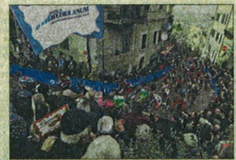
Una tappa della Tirreno-Adriatico

ciclismo: da anni infatti l'istituto è sponsor anche del Giro d'Italia. Una scelta tutt'altro che casuale: si è voluto infatti legare la visibilità del marchio Mediolanum ai valori che caratterizzano il ciclismo, di cui si condividono le determinazioni, il lavoro di squadra e lo spirito di sacrificio per il raggiungimento dell'obiettivo. Ma l'iniziativa ha avuto anche un altro scopo: creare una nuova occasione di incontro e divertimento per i clienti della Banca, che hanno potuto seguire da vicino la corsa e vivere tutte le emozioni della gara grazie agli esclusivi pass per le aree hospitality. Un'opportunità che rientra ormai nella tradizione di Banca Mediolanum, che