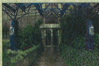
La conferenza di MCU a Milano Tre City