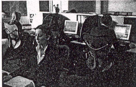
Il Banking Center presso la sede di Banca Mediolanum a Milano

NON BASTA FORNIRE al cliente un buon prodotto. Il prodotto deve essere il migliore. E il servizio (nei limiti umani) perfetto. La regola vale per chiunque faccia impresa. E vale soprattutto per Banca Mediolanum, che sa che i suoi clienti hanno assimilato la filosofia che sta alla sua base, quella che il fondatore, Ennio Doris, sintetizza nello slogan «La banca costruita intorno a te». E che Oscar Wilde rendeva in questa forma: «Io ho gusti semplici; mi accontento sempre del meglio». Gli anglosassoni la chiamano Customer oriented organization, organizzazione che ruota attorno all'utente, a ciò che l'utente vuole e a ciò di cui ha bisogno.