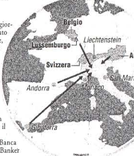
Lo Scudo punta a far rientrare i capitali dai "Paradisi fiscali"

E nel trasferire capitali e risorse finanziarie dall'estero, Banca Mediolanum offre un ampio ventaglio di soluzioni e servizi: a partire dal conto corrente Freedom, con le sue condizioni di assoluta convenienza (tasso d'interesse al 2,50% netto), fino ai prodotti e alle soluzioni d'investimento e di risparmio gestito. In pratica, una risposta adeguata ad ogni necessità specifica, strumenti bancari e finanziari per ogni profilo di clientela. Basta presentare la propria "dichiarazione riservata" in Mediolanum, e ogni cliente ha a disposizione la consulenza professionale e specializzata del proprio Family Banker di riferimento, che si occupa di tutti gli adempimenti, i passaggi e le attività necessarie a completare le operazioni collegate allo Scudo fiscale. Al riguardo, i Family Banker hanno anche seguito specifiche attività e seminari di formazione, alcuni in aula, alla Mediolanum Corporate University (MCU), altri attraverso corsi e aggiornamenti online. Il rimpatrio di beni e capitali passa anche dalla professionalità e competenza delle persone a cui vengono affidati, visto che si tratta di questioni, e patrimoni, da maneggiare con la massima cura, e riservatezza.