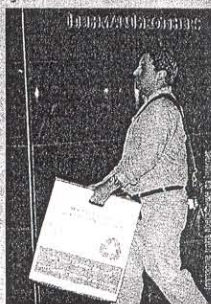
Un ex-dipendente Lehman svuota gli uffici dopo il crac

Una beffa è un danno doloroso per molti, ma non per i clienti di Banca Mediolanum. Per loro il caso-