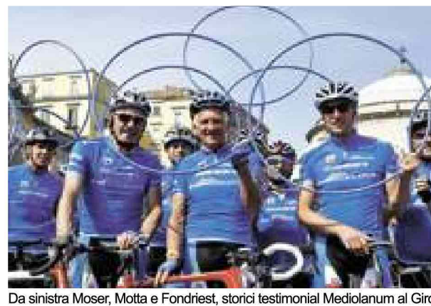
Da sinistra Moser, Motta e Fondriest, storici testimonial Mediolanum al Giro

Per il tredicesimo anno consecutivo Banca Mediolanum è salita in sella prendendo parte alla 98esima edizione del Giro d'Italia, partenza da Sanremo il 9 maggio. E lo ha fatto ancora una volta come sponsor del Gran Premio della Montagna con la maglia azzurra, dedicata al miglior "scalatore", simbolo di italianità ma non solo: anche di impegno, sacrificio, e forza del singolo individuo ma allo stesso tempo della capacità di fare squadra e del lavoro di gruppo. Concetti in profonda sintonia con i valori e la filosofia sui quali poggia l'esperienza di Banca Mediolanum. Come sempre, anche per l'edizione 2015 la presenza di Banca Mediolanum al Giro d'Italia, che si concluderà a Milano il 31 maggio, sarà arricchita da pranzi esclusivi su invito lungo il percorso, cene di gala in location di eccezione, pedalate amatoriali e tante altre iniziative