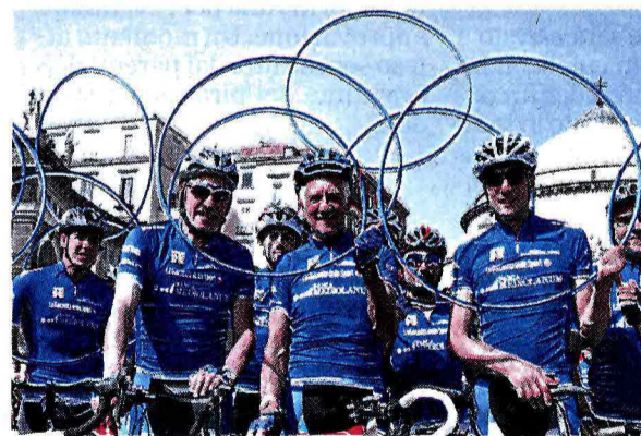
Da sinistra Moser, Motta e Fondriest, storici testimonial Mediolanum al Giro

network grazie a un sapiente lavoro di squadra. Dalla pagina dedicata all'evento sportivo, storiadalgiro.it che nel 2014 ha avuto oltre 21mila visite, alla presenza in diretta su Twitter (circa 4mila Tweet dedicati nel 2014) e Facebook (381 post dedicati) a dimostrazione del fatto che anche in questo caso Banca Mediolanum dedica