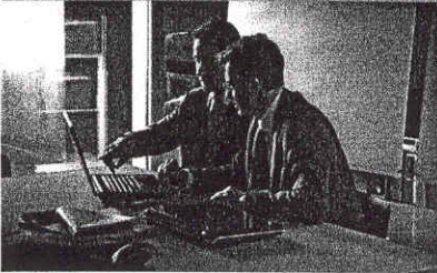
Family Banker, assistenza costante e personalizzata al cliente

Il Gruppo Mediolanum mette sul piatto: solidità, quella di un Gruppo finanziario di livello internazionale, preparazione, garantita a tutti i Family Banker anche attraverso la propria prestigiosa università aziendale, la Mediolanum Corporate University (MCU); possibilità di crescere dal punto di vista economico e di carriera. Come spesso è difficile fare altrove.