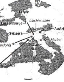
Lo Scudo punta a far rientrare i capitali dai 'Paradisi fiscali'

Il via è scattato da pochi giorni, e il termine ultimo è fissato per la metà del prossimo aprile, ma per cogliere le opportunità offerte dallo Scudo fiscale varato dal governo in realtà è meglio muoversi subito senza perdere tempo. E senza perdere questa ultima occasione per regolarizzare e far rientrare capitali e beni detenuti all'estero e non dichiarati (oltre i 10mila euro), in modo da mettersi in regola con il Fisco e sanare ogni irregolarità. In questo quadro, Banca Mediolanum e i suoi Family Banker rappresentano un riferimento e un interlocutore prezioso, fondamentale, per aderire al provvedimento - basta presentare la propria dichiarazione