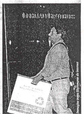
Un ex-dipendente Lehman svuota gli uffici dopo il crac

Un anno fa scoppiava il caso Lehman Brothers. Una delle più prestigiose banche d'affari americane chiudeva i battenti travolta dai debiti generati dalla cattiva finanza a stelle e strisce. Un crollo che segnò il momento più acuto e aprì il baratro più profondo della crisi americana, che da Wall Street si è poi allargata a livello internazionale. Restano ancora