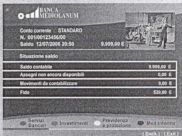
Una schermata di Banca Mediolanum sul digitale terrestre

Una volta connessi, in base alle proprie esigenze e grazie all'interattività del decoder, si può selezionare, scorrendo sul menu, l'area di interesse (servizi banca-